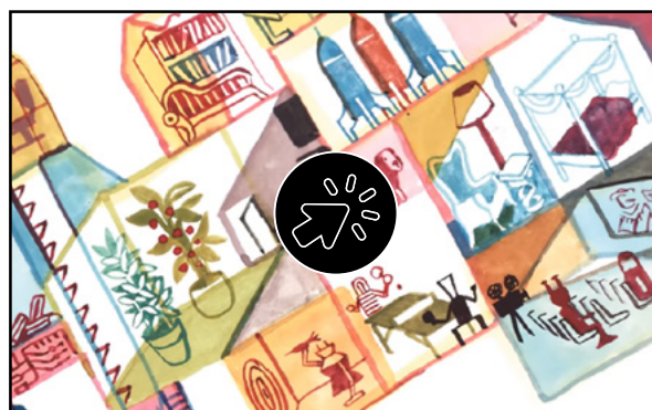
Les Cromosaures de l'Espace - Bande annonce