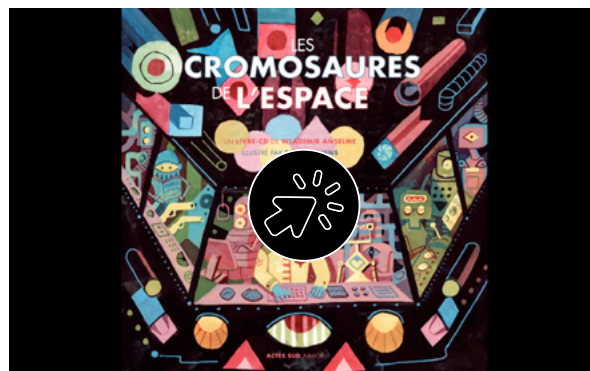
Chanson de la myriade de papillons et de la rivière d'argent